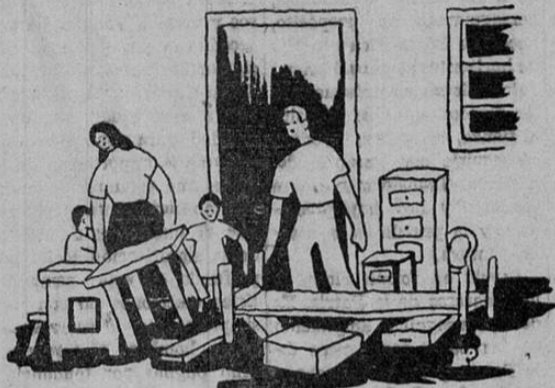
ANTES DE LA LEGISLACION SOCIAL

Hay además una política de reparto de tierras que está comenzando a ejecutarse. Ya se han repartido, bajo este Gobierno 20 mil hectáreas entre campesinos pobres.