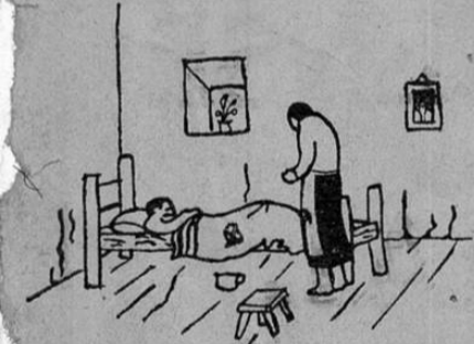
ANTES DE LA LEGISLACION SOCIAL

el patrón podía echar a patadas a un trabajador cuando así le convenía.