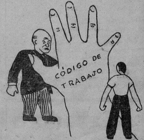
AHORA, CON LA LEGISLACION SOCIAL

el Estado fija todos los años precios buenos para el arroz, el maíz, los frijoles y las papas; y el Banco Nacional está obligado a comprar a los agricultores sus artículos a esos precios; la ley obliga al Banco Nacional a construir bodegas en todos los centros de producción para recibir los granos; y lo obliga a adelantar dinero en préstamo a con la garantía de las cosechas; con ese objeto, el Poder Ejecutivo puso en manos del Banco dos millones de colones. La ley apenas está comenzando a aplicarse. Sus efectos no se han sentido todavía en algunos lugares. Pero va este año son muchos los agricultores beneficiados. Y el año entrante lo serán muchos más. El agricultor, seguro de que venderá a precios que nunca le dejarán pérdida la cosecha siembra y ésta es una forma efectiva de combatir el especulador.