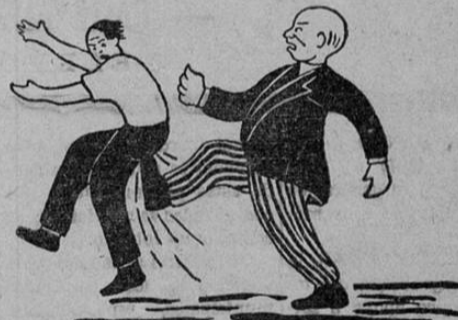
ANTES DE LA LEGISLACION SOCIAL