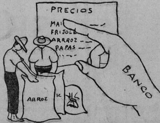
AHORA, DESPUES DE LA LEGISLACION SOCIAL

hay un CODIGO DE TRABAJO y unas GARANTIAS SOCIALES que protegen al trabajador. El salario no lo fija el patrón sino el Estado tomando en cuenta las necesidades del trabajador, el costo de la vida y la situación de cada industria o de cada agricultura. Además, la duración de la jornada de trabajo está establecida por la ley.