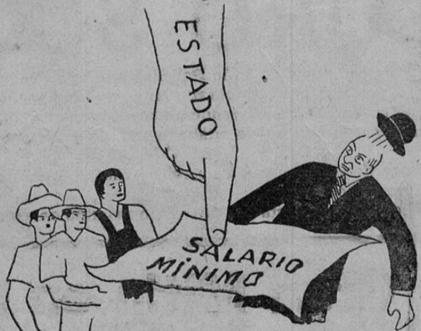
AHORA, CON LA LEGISLACION SOCIAL

el patrón era quien fijaba los salarios según sus conveniencias y podía obligar a sus peones y obreros a trabajar todas las horas que le daba la gana.