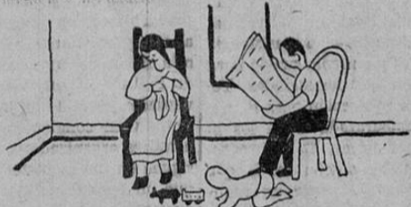
AHORA, CON LA NUEVA LEGISLACION SOCIAL:

El trabajador era echado de la casa cuando se atrasaba en el pago del alquiler y el casero podía tirarle los muebles a la calle, sin ninguna consideración.