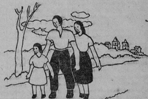
AHORA, CON LA LEGISLACION SOCIAL

el trabajador se doblaba todo el año sin de derecho a vacaciones y los días feriados no se los pagaban.