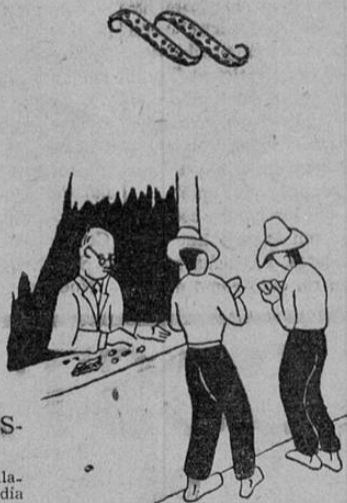
ANTES DE LA LEGISLACION SOCIAL