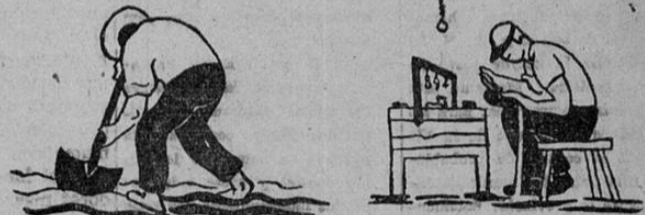
ANTES DE LA LEGISLACION SOCIAL

el trabajador se doblaba todo el año sin de derecho a vacaciones y los días feriados no se los pagaban.